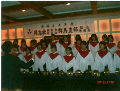
新島学園中学・高等学校 聖歌隊の皆様

お開きでは、全員が肩を組み、輪になりカレッジソング斉唱と同志社チェアーをして、高揚感のうちに閉会となりました。